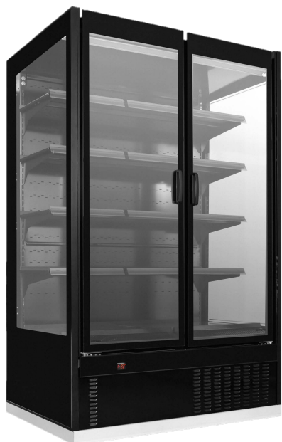
MVP Baixa Temperatura Individual