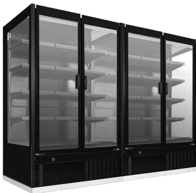
MVP Baixa temperatura Duplo