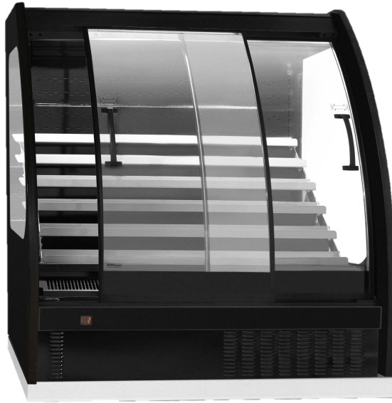
MVP Semi Vertical Individual