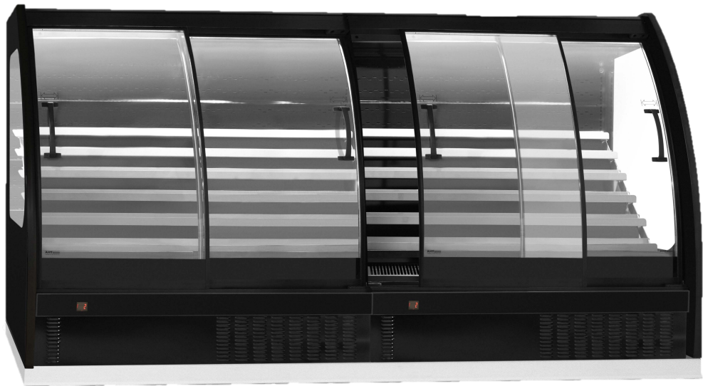
MVP Semi Vertical Duplo